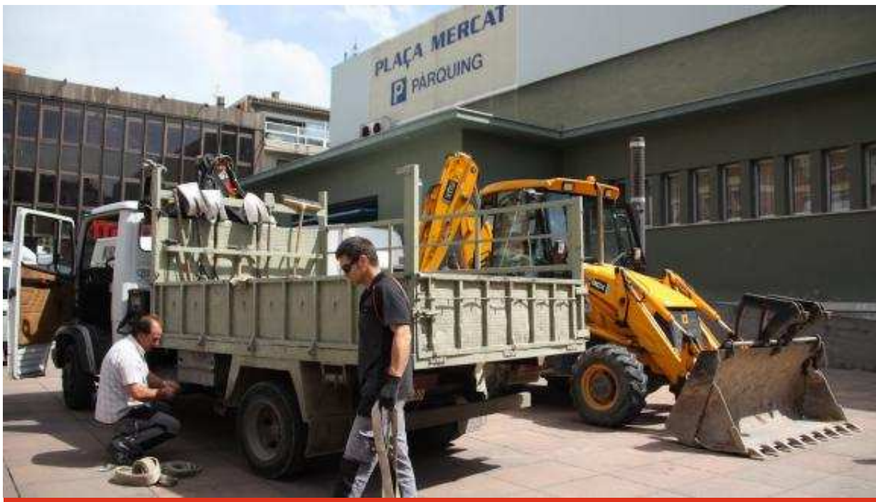
Les primeres màquines treballant a la Plaça Mercat d'Olot aquest matí

Per a fer-ho vol aprofitar les obres a la Plaça Mercat